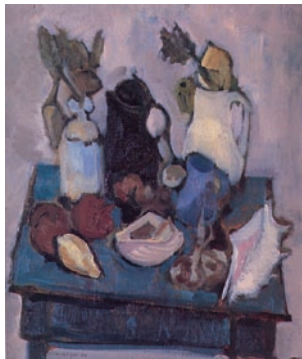
Oretta Dalle Ore poesie